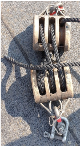
Talja med 2 st 3-skurna block, löplina och schacklar (med låsningar)

- en för BB och en för SB, dessa monteras på följande sätt: