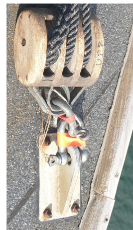
- fast block fästes via TVÅ schacklar i beslaget på båtdäcket (översidan av passagerardäckets undertak)

Nödstyrningen hanteras stående mellan de ordinarie styrstängerna - detta för att minska MOB-risken.