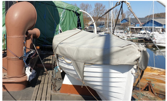
Utrustning för nödstyrning ligger i SB livbåt på båtdäck (akter om bryggan)

LÄS instruktionen helt! Följ kaptens order.